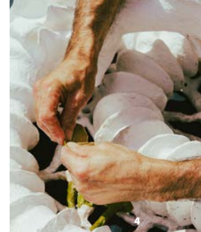
4. Michel Brassac © Michel Brassac